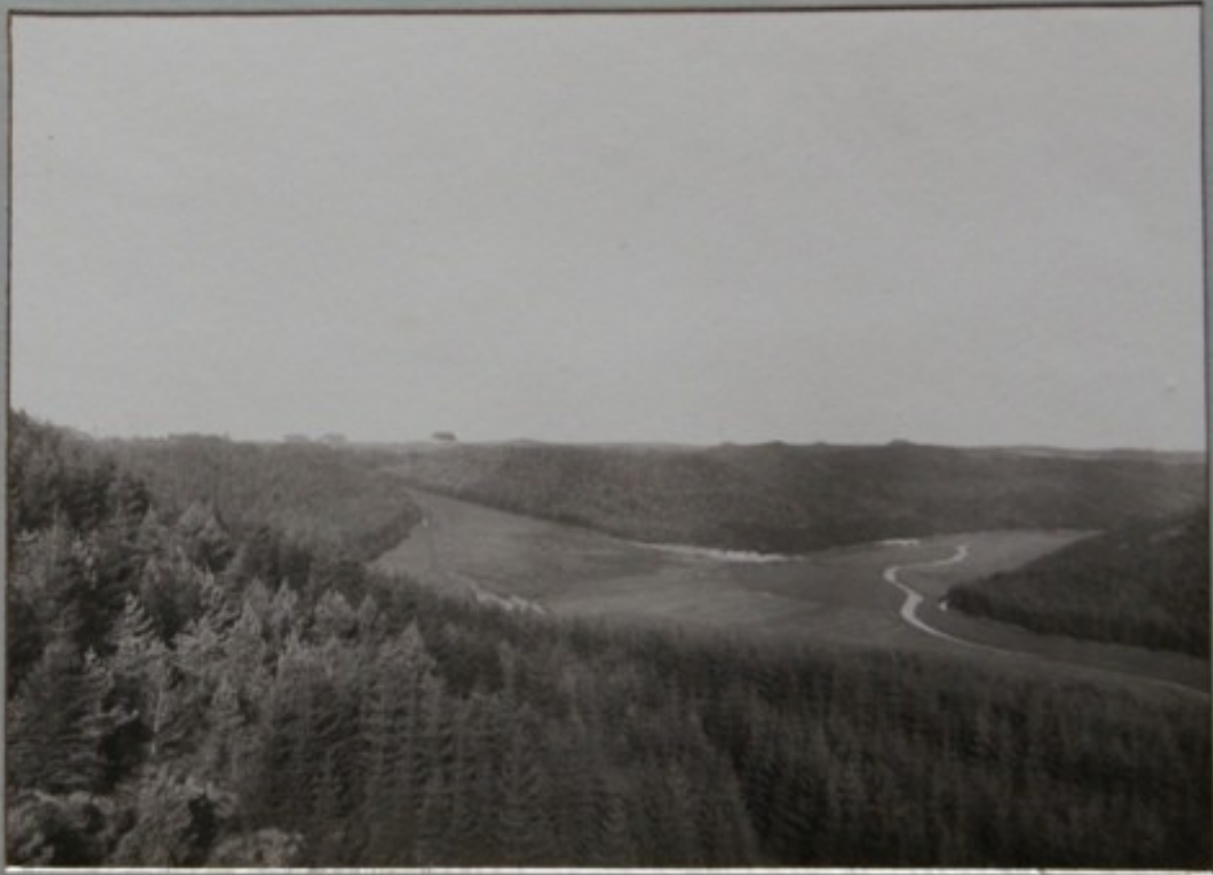
VED FREDENS BÆNK