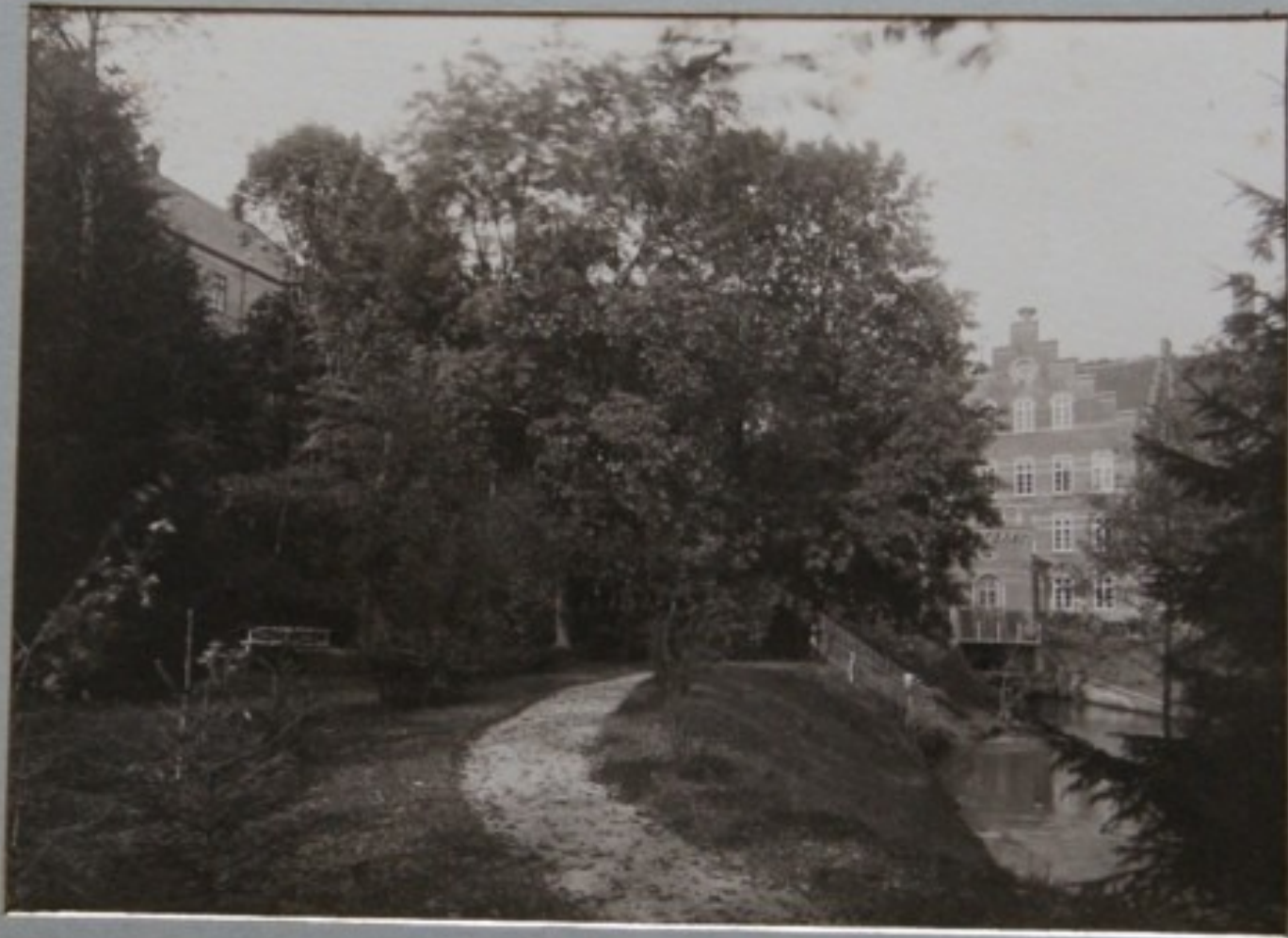
FRA ANLÆGET VED KILDEN