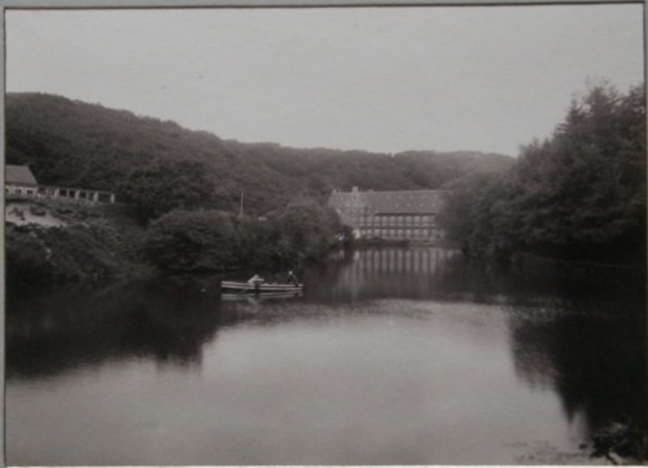
FRA ADAS BÆNK