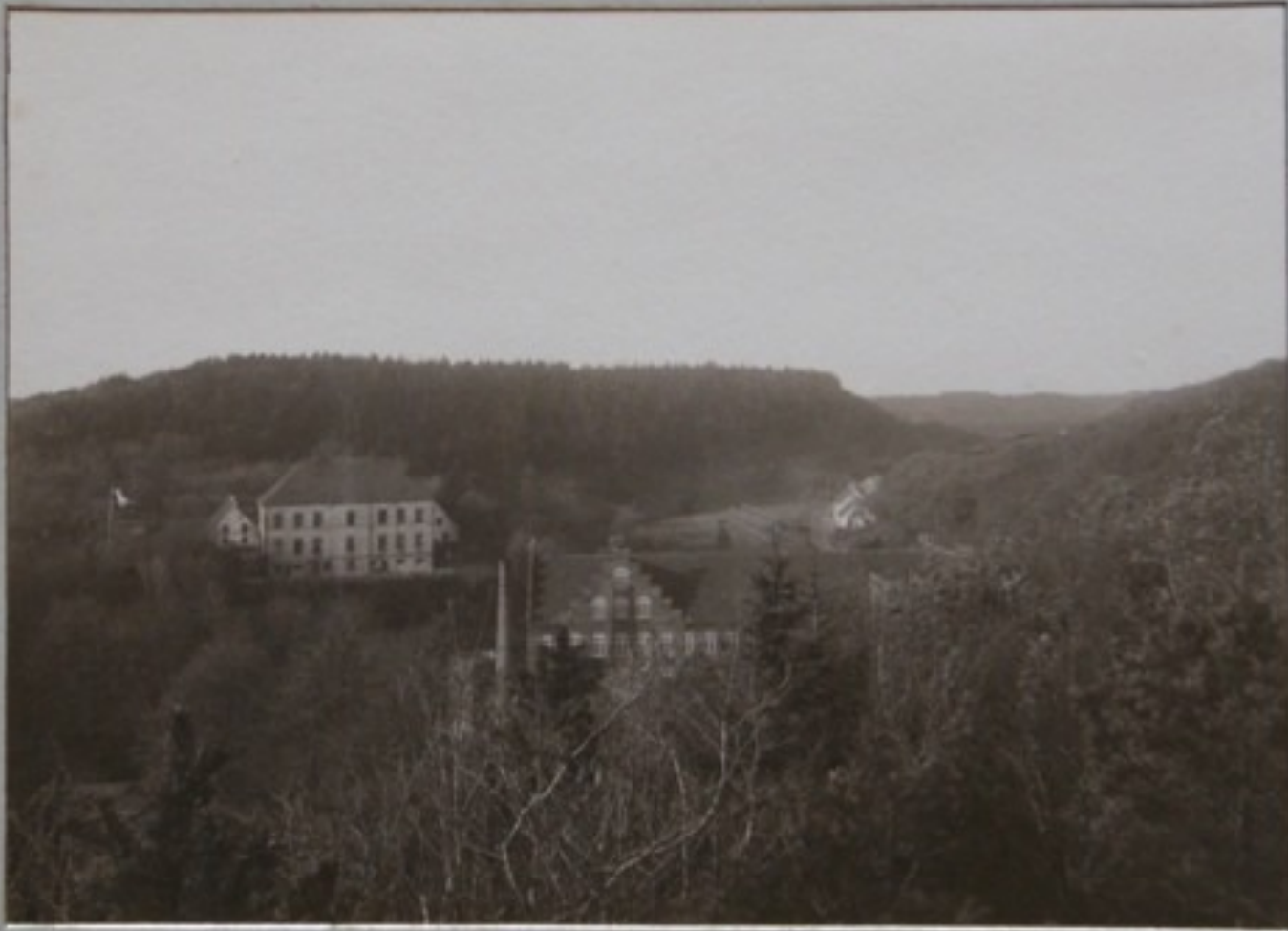
FRA FRUENS BÆNK