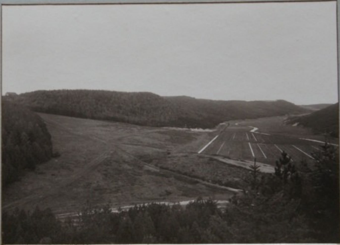
VED STUDENTERNES BÆNK