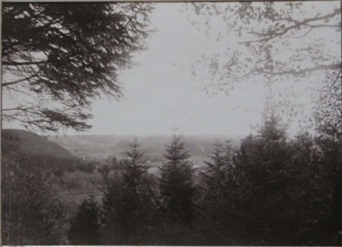
FRA CONSTANCE HILL